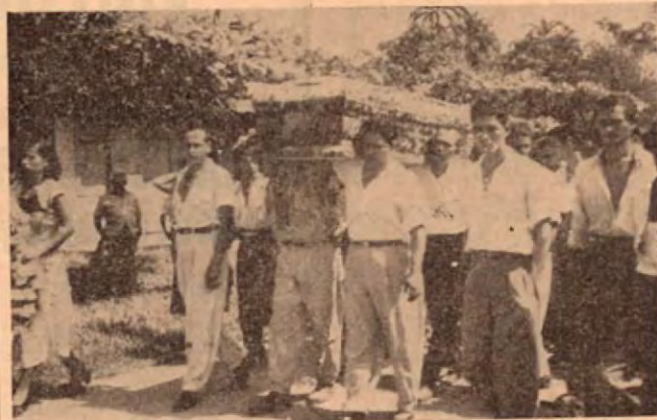
Deudos y amigos conducen la caja mortuoria a la iglesia.

Por eso el 14 de agosto marca en esa linda población una fecha dolorosa que en el recuerdo vivirá como el eco de las cosas imborrables.