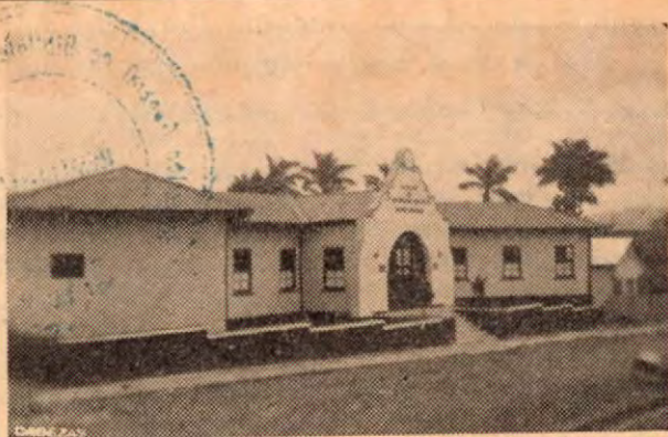
UNIDAD SANITARIA DE TURRIALBA