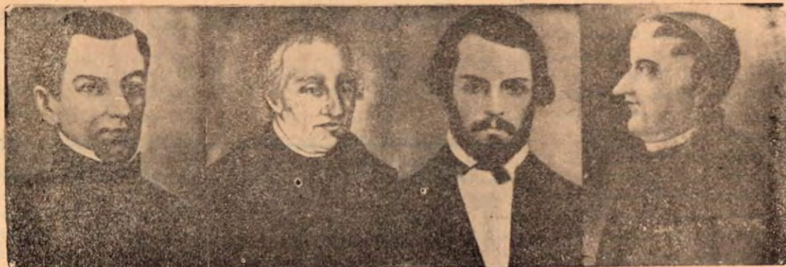
He aquí a los próceres de la emancipación centroamericana

A casi siglo y medio del bizarro pronunciamiento de San Salvador, volvemos los ojos a los paladines de ese acto que habiendo sido el inicio de la redención política del Istmo hubo de tener en el Padre José Matías Delgado la cifra más alta, el hombre símbolo de un pueblo anheloso de progreso y de libertad.